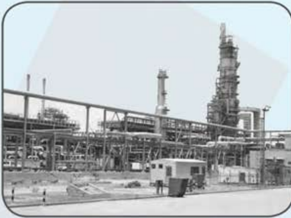
شكل (٢٩) صور توضح عملية تكرير النفط