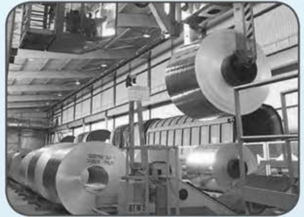
شكل (٢٨) صور توضح الصناعات في دول الخليج العربية