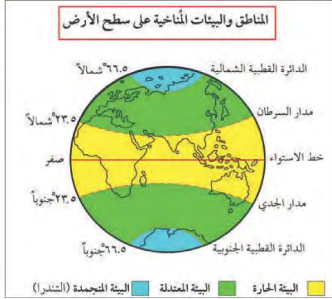
شكل رقم (٢٠)