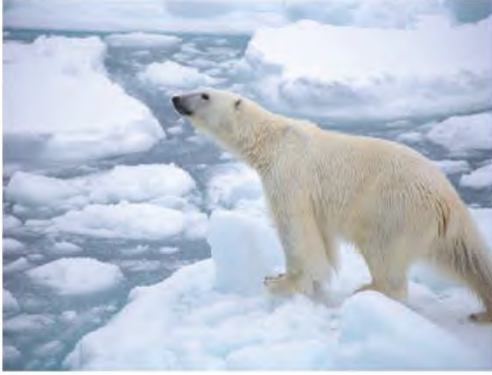
بيئتي قمت جمدة

- لاحظ الصور التي أمامك ثم حدد أنواع البيئة المناسبة لها.