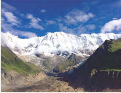
شكل رقم (١٩)

قال الله - تعالى - في سورة النحل: ( وَهُوَ الَّذِي سَخَّرَ الْبَحْرَ لِتَأْكُلُوا مِنْهُ لَحْمًا طَرِيًّا وَتَسْتَخْرِجُوا مِنْهُ حِلْيَةً تَلْبَسُونَهَا وَتَكْزِي الْفُلُوكَ مَوَاجِرَ فِيهِ وَلِتَبْتَغُوا مِنْ فَضْلِهِ وَلَعَلَّكُمْ تَشْكُرُونَ ﴿١٤﴾ ) سورة النحل الآية: ١٤