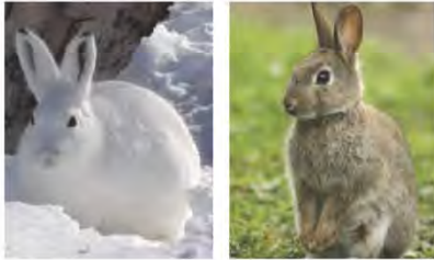
شكل رقم (٢١)

تعتمد بعض الحيوانات التي تعيش في البيئة المتجمدة (إقليم التندرا) إلى تغيير لون كسائها من البني إلى الأبيض لكي تختبئ أثناء تساقط الثلوج. انظر شكل (٢١)