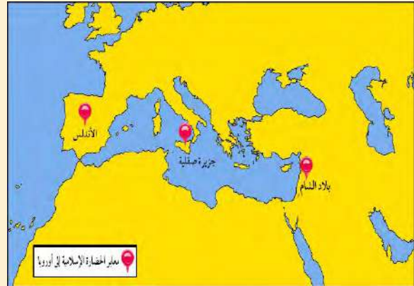
شكل (١٣) الدول الحديثة مراكز أشعاع الحضارة الإسلامية