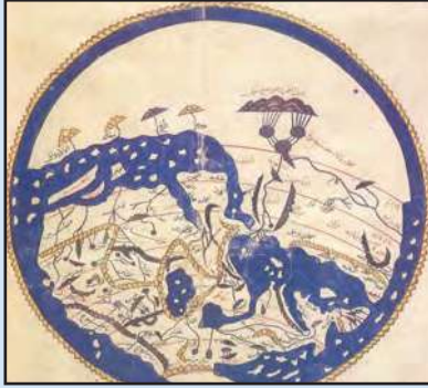
شكل (١٤) خريطة الإدريسي التي رسمها لكروية الأرض

-اشتغل بتأليف الجغرافيا ، وألف كتابه المشهور (نزهة المشتاق في اختراق الآفاق) الذي أعجب به الأوروبيون وترجموا هذا الكتاب إلى لغاتهم . وكان الإدريسي يؤمن بكروية الأرض ورسم خريطة تمثلها في الوقت الذي كان الأوروبيون يظنون أن الأرض مسطحة ، ولو أبحر مركب في المحيط الأطلسي مثلاً واتجه نحو الغرب لسقط عند حافة الأرض ولا يعود .