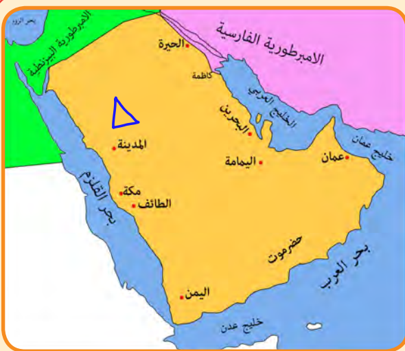
شكل رقم (١) خريطة شبه الجزيرة العربية قديماً والحضارات المجاورة لها

أ - الحضارة الفارسية ..... الحضارة البيزنطية ..... ب - الحضارة البيزنطية ..... الحضارة الفارسية