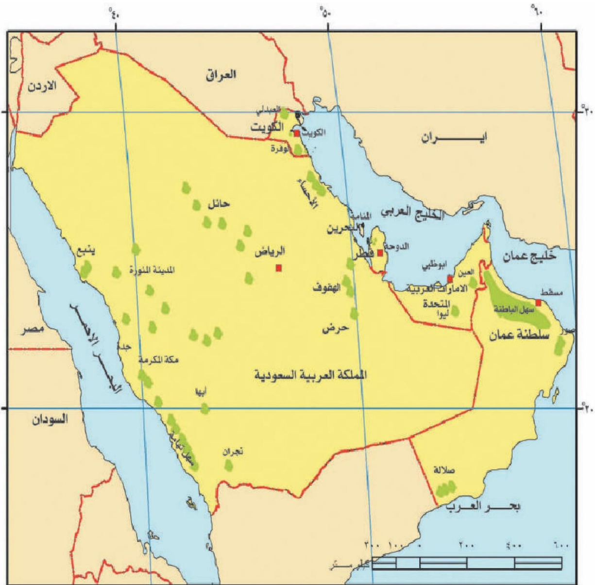
شكل (٢٥) خريطة توضح الزراعة في دول الخليج العربية

على الرغم من الصعوبات التي تواجه الأراضي الزراعية في معظم دول الخليج العربية إلا أن الحكومات تبذل أفضل الجهود للتغلب على هذه الصعوبات ، ونجحت بإنتاج محاصيل متنوعة نشاهدها في الأسواق . وللمملكة العربية السعودية تجربة رائدة في إنتاج محصول القمح .