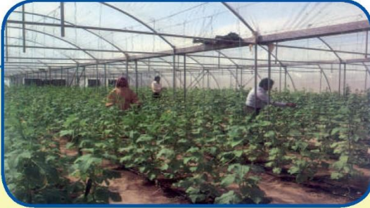
شكل (٢٧) صورة توضح : الزراعة في البيوت البلاستيكية في دولة الكويت

يزرع فيها الخضراوات في غير مواسمها (أوقاتها) وتقوم بحماية المحاصيل من تقلبات الطقس .