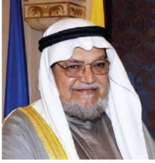
الدكتور (عبدالرحمن السميّط)