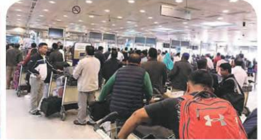
الزيادة الغير طبيعية

٣ لاحظ الأشكال التالية ثم ضع علامة (✓) تحت الصورة الأكثر كثافة: