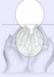
الاكثار من الدعاء