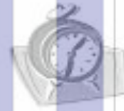
التذكير إلى الصلاة

( ب ) عن عبدالله بن مسعود - رضي الله عنه - أن رسول الله - صلى الله عليه وسلم - قال : ( إِنَّ الشَّمْسَ وَالْقَمَرَ لَا يَنْكَسِفَانِ لِمَوْتِ أَحَدٍ مِنَ النَّاسِ ، وَلَكِنَّهُمَا آيَاتَانِ مِنْ آيَاتِ اللَّهِ فَإِذَا رَأَيْتُمُوهُمَا فَقُومُوا فَصَلُّوا ) . ( ثلاث درجات )