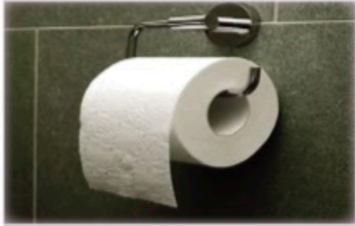
٢- المناديل الورقية.

١- الاستنجاء هو : تطهير السبيلين من الخارج منهما بالماء أو ماينوب عنه كالمناديل الورقية