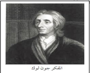
المفكر جون لوك