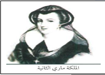
الملكة ماري الثانية

- (تطور النظريات السياسية " السيادة الشعبية " لجون لوك).