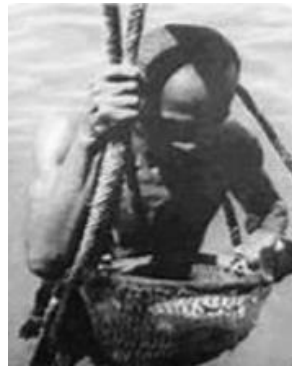
الغوص على اللؤلؤ