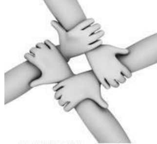
وحدة الهدف والمصير