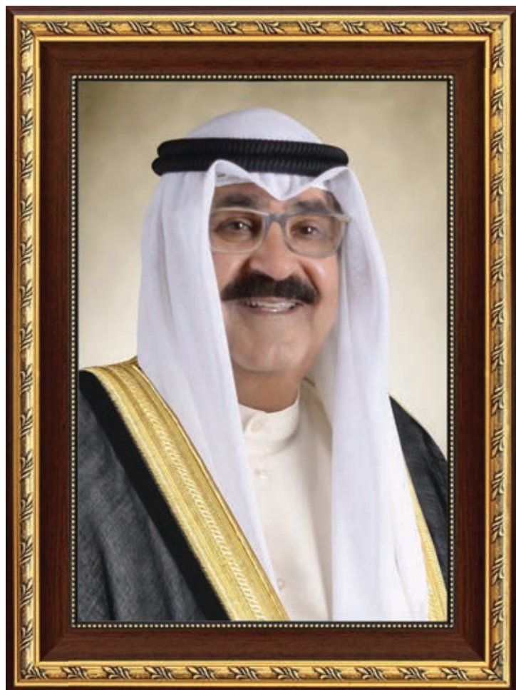
سمو الشيخ مشعل الأحمد الجابر الصباح ولي عهد دولة الكويت H.H. Sheikh Meshal AL-Ahmad AL-Jaber AL-Sabah The Crown Prince Of The State Of Kuwait