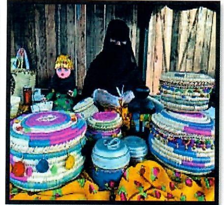
١- صناعة الخوص

و - لاحظ خريطة دول الخليج العربية ، ثم نفذ استعن بالمدلولات التي عليها لاكمال العبارات التالية :