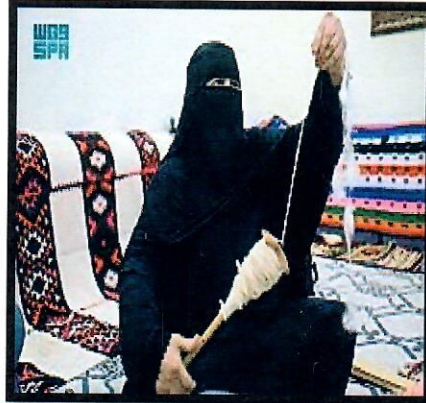
٢- حياكة السدو