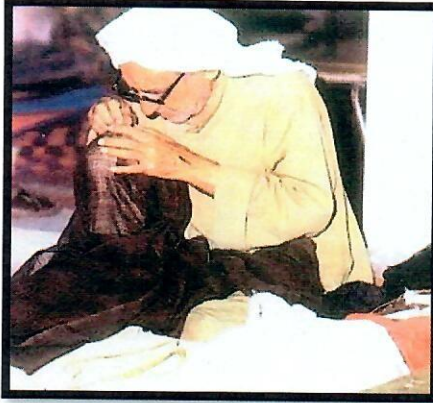
٣- خياطة البشوت

هـ - اختر الاسم المناسب لصور الحرف من القائمة التالية وسجله أدناها : ص ٢٩ - ص ٣٣ ( حياكة السدو - صناعة الخوص - صناعة السفن - خياطة البشوت )