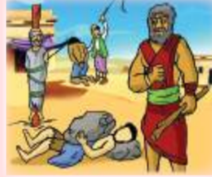
تَغْذِيبُ الضُّعَفَاءِ وَالْفُقَرَاءِ

سلوكيات وأخلاق غير صحيحة يجب الابتعاد عنها :