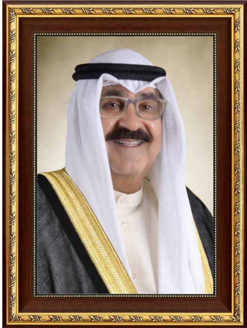
سمو الشيخ مشعل الأحمد الجابر الصباح ولي عهد دولة الكويت

H.H. Sheikh Meshal AL-Ahmad Al-Jaber Al-Sabah The Crown Prince Of The State Of Kuwait