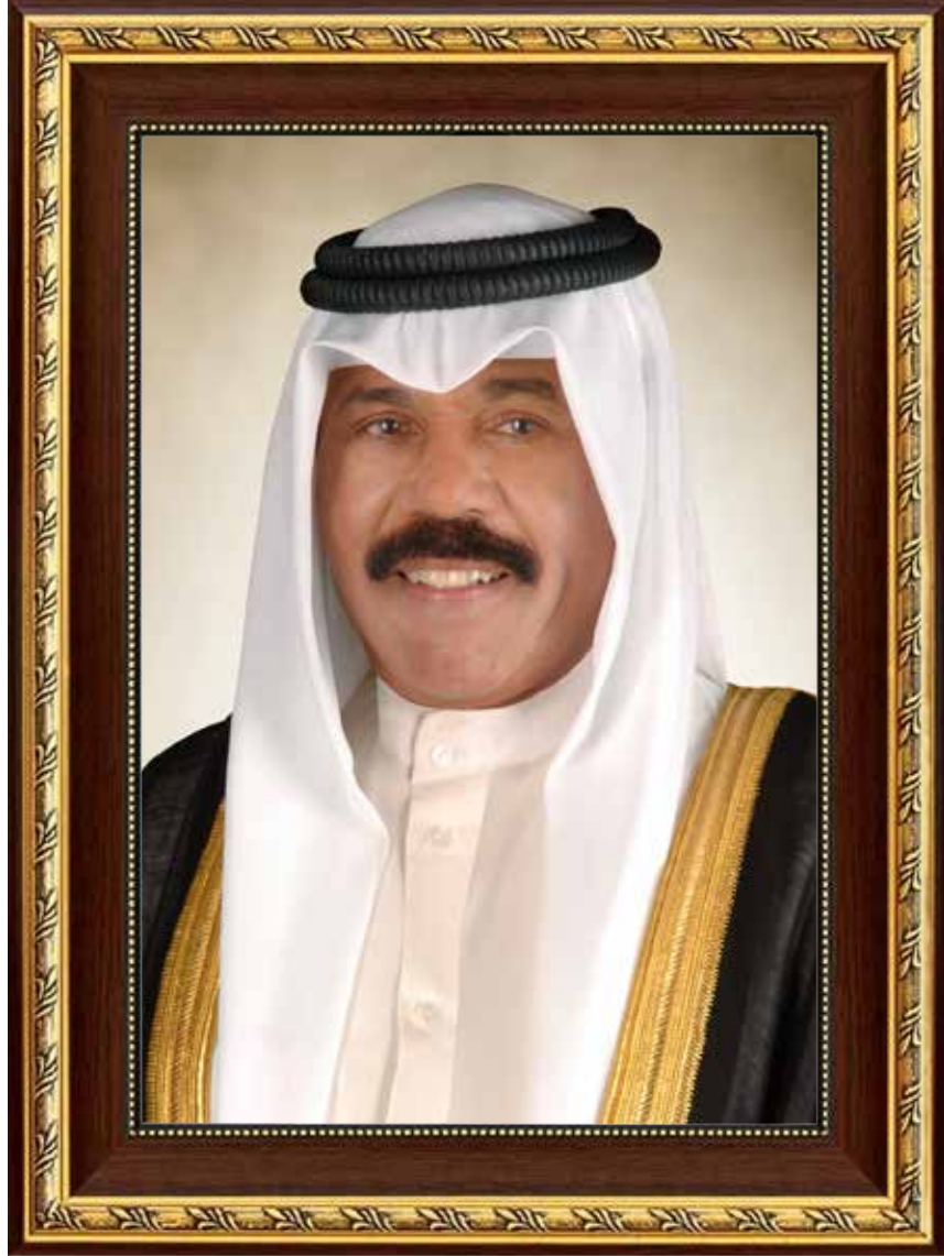
حضرة صاحب السمو الشيخ نواف الأحمد الجابر الصباح أمير دولة الكويت

H.H. Sheikh Nawaf AL-Ahmad Al-Jaber Al-Sabah The Amir Of The State Of Kuwait