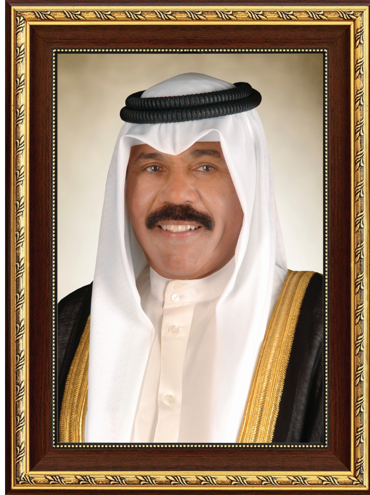
حضرة صاحب السمو الشيخ نواف الأحمد الجابر الصباح أمير دولة الكويت

H.H. Sheikh Nawaf AL-Ahmad Al-Jaber Al-Sabah The Amir Of The State Of Kuwait