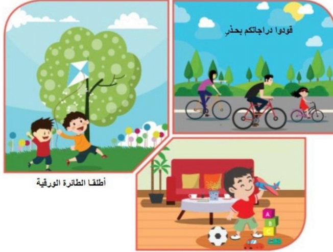
أطلقا الطائرة الورقية

ب - أَعْبُرْ عَنْ كُلِّ صُورَةٍ مِمَّا يَأْتِي بِجُمْلَةٍ مُفِيدَةٍ تَحْتَوِي فِعْلَ أَمْرٍ، مُوجِّهًا الْخِطَابَ لِلْمُفْرَدِ مَرَّةً وَلِلْمُتَنَّى وَلِلْجَمْعِ مَرَّةً أُخْرَى: